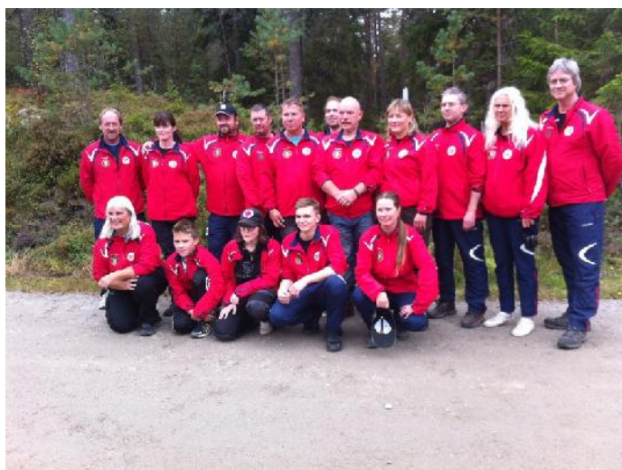
Norske landslagstroppen under Nordisk feltmesterskap 2013 på Mysen

Det blir avholdt treningssamling i forkant av mesterskapet. Tid og sted avhenger av hvor mesterskapet avholdes. Informasjon blir sendt de uttatte skytterne.